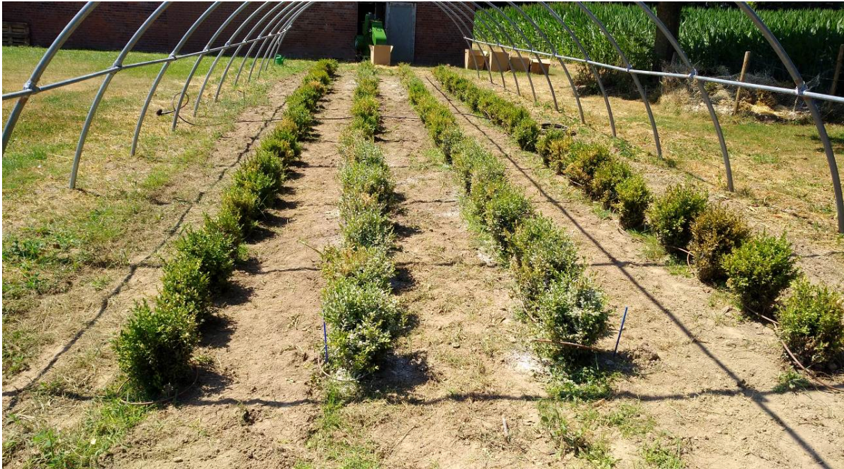
Ansicht der Versuchsanlage am Tage der ersten Algenkalk Anwendung (Tunnel noch ohne Netzabdeckung)